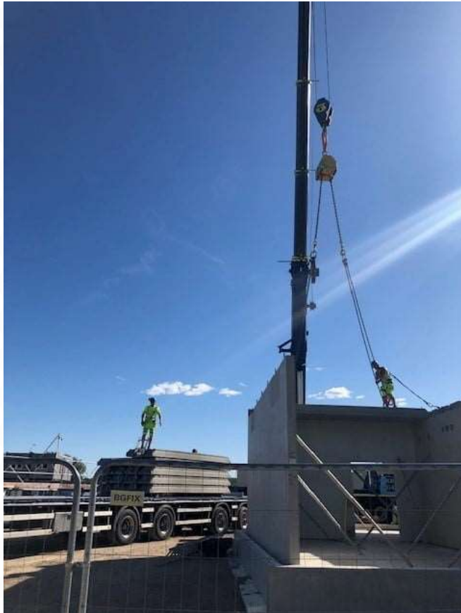
Bild: Montage av väggelement i Kv Almen , Tollarp.

Sandwichväggar (W) och Halvsandwichväggar (IV) med cellplastisolering (Stenull) med Starkas bästa betongrecept