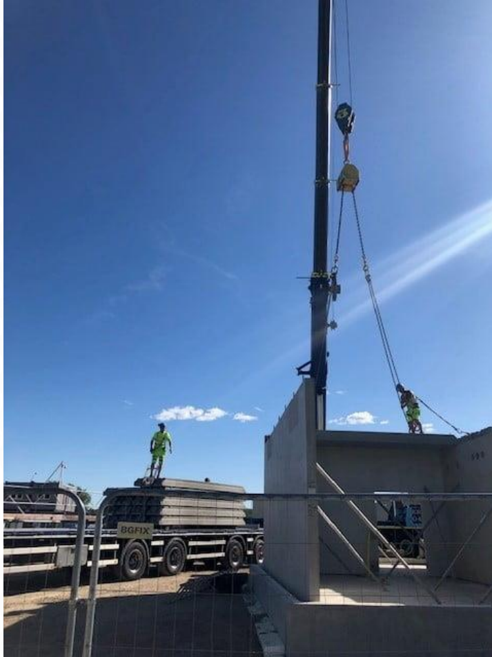
Bild: Montage av väggelement i Kv Almen , Tollarp.

Sandwichväggar (W) och Halvsandwichväggar (IV) med cellplastisolering (fenolskum) med Starkas bästa betongrecept