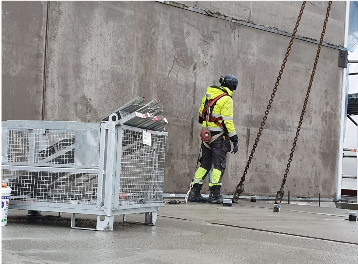
Bild: Montage av väggelement i Kv Gunhild , Brf Porla och Koittra, Spånga.

Utförd med IVL:s förhandsgranskade EPD IVL EPD generator Betong NEPDT28