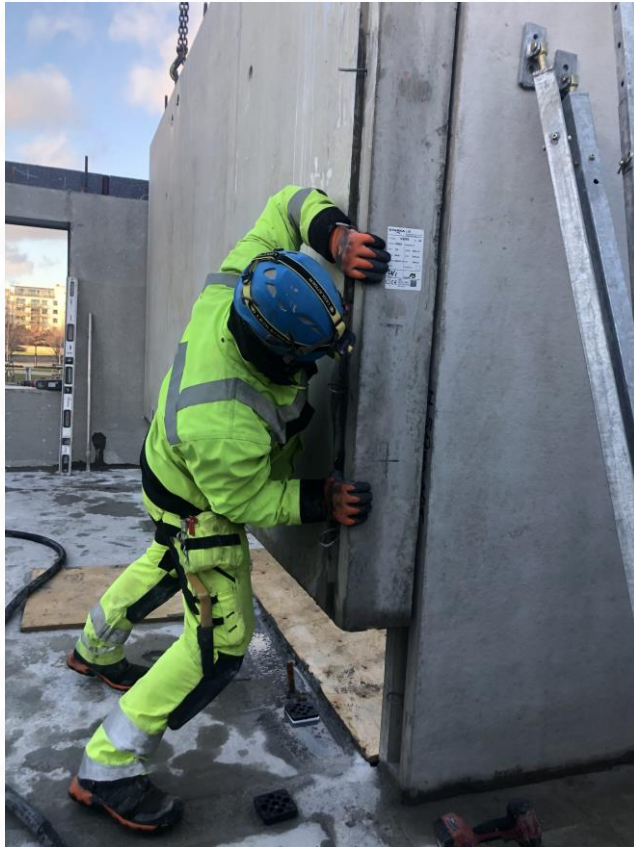
Foto: Montage av Parken 4 , Brf Jogga, Sporta & Gymma i Malmö

Massivväggar (V) och Massiva slakarmerade plattor (D) med Starkas bästa betongrecept