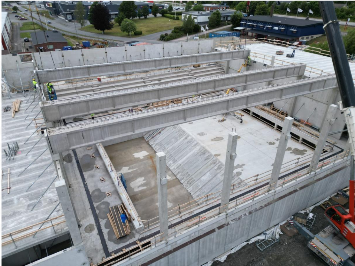
Foto: Österåsbadet i Hässleholm.

Utförd med IVL:s förhandsgranskade EPD IVL EPD generator Betong NEPDT28